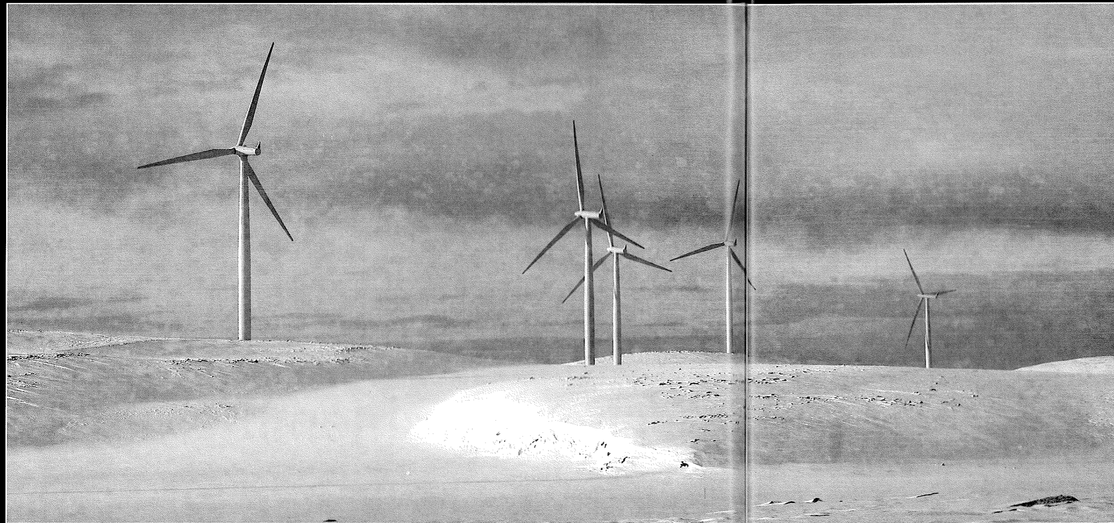
Vindkraft Nord ønsker å bygge en vindkraftpark sør for Kunes.

Utviklingsavdelingen arbeider med søknad til Kystverket om tilskudd til fiskerihavner, post 60 midler. Det søker om tilskudd til ny fiskerikai i Kjøllefjord, og søknadsfristen er 1. april. Det vil ikke komme svar på søknaden før statsbudsjettet legges frem til høsten.